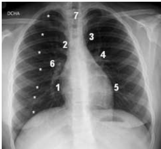
FIGURA 4. Radiografía normal anteroposterior.

1: silueta de la aurícula derecha; 2: vena cava superior; 3: cayado aórtico; 4: arteria pulmonar izquierda; 5: ventrículo izquierdo; 6: arteria pulmonar derecha; 7: tráquea. Los arcos costales anteriores están marcados con asteriscos.