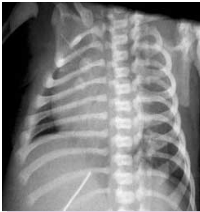
FIGURA 1. Radiografía rotada de un recién nacido. Los núcleos de osificación del esternón se proyectan sobre el hemotórax derecho.

mentarios, el corazón, los vasos pulmonares y el parénquima pulmonar.