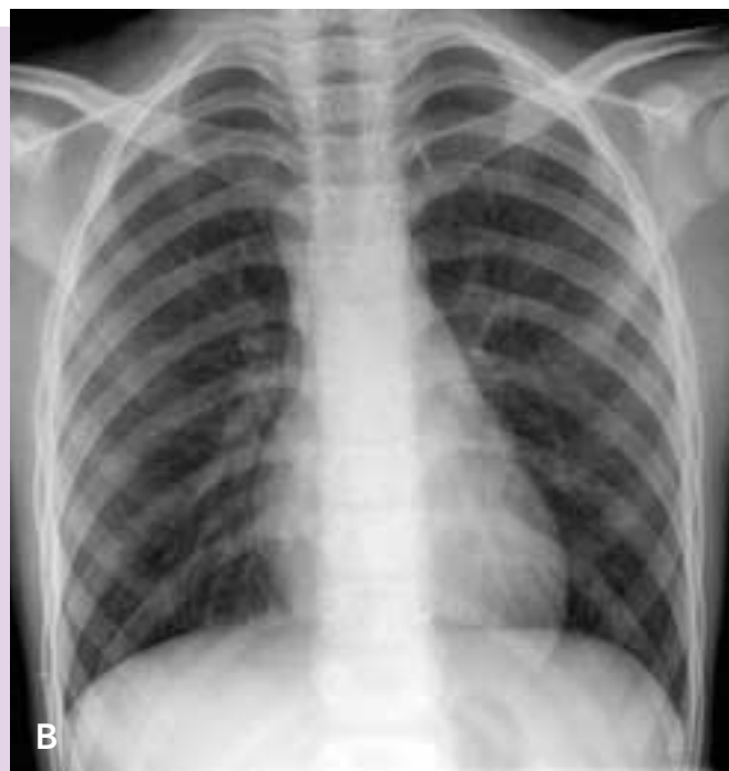
FIGURAS 2 Y 3. Radiografía espirada (A) y radiografía adecuadamente inspirada del mismo niño (B). La primera fue malinterpretada como patrón intersticial. En la segunda se aprecia la morfología rectangular alargada del tórax del niño mayor.