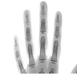
2 años y medio