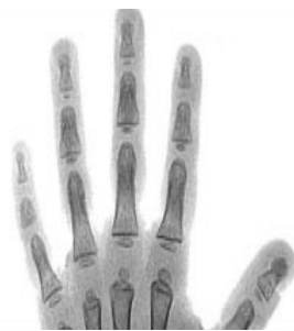
2 años y medio