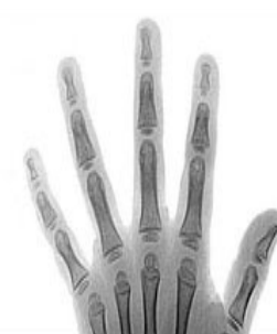
4 años y medio