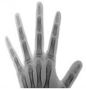
5 años y medio