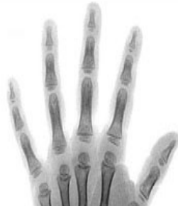
3 años y medio