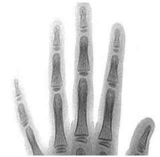
3 años y medio