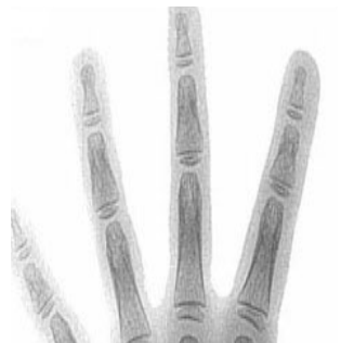
5 años y medio