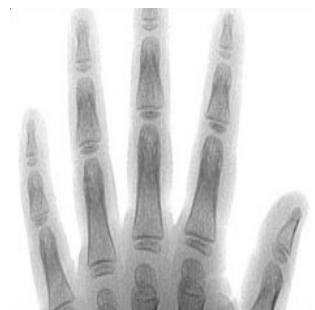
4 años y medio